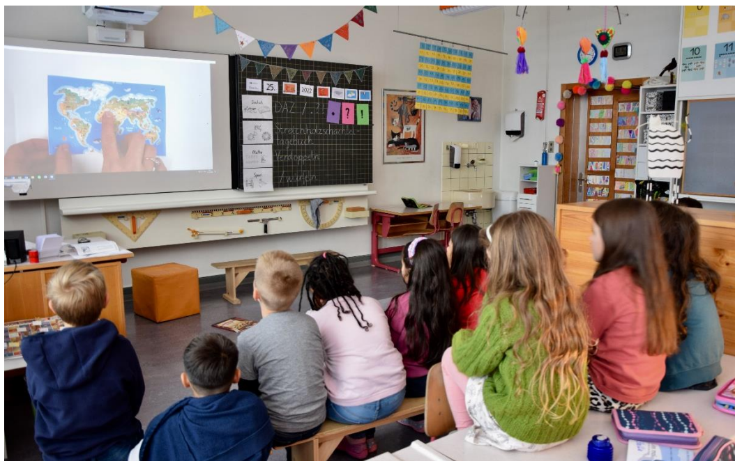
Abbildung 2: Das Lehrmittel «migrationsgeschichte» im Unterricht