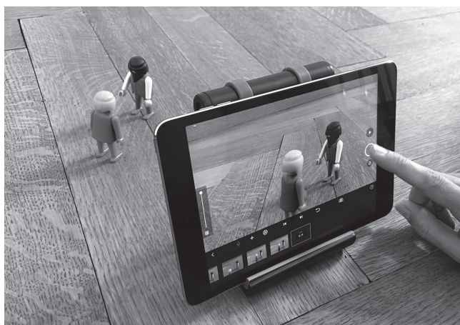
Trickfilm mit der App Stop Motion

An einem dritten Posten konnten die Lernenden mit Makrolinsen, die über die Kameralinse des iPads geklemmt wurden, Nahaufnahmen von Gegenständen und Pflanzen machen.