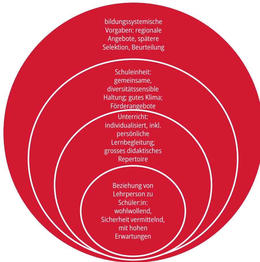
Abbildung 2: Schuleinheit auf dem Weg zu Chancengerechtigkeit