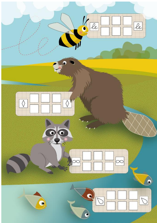
Abbildung 3: Screeningbogen 2 (aus: GRAFOS-2; Sägesser et al., im Druck)