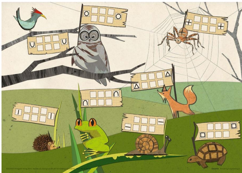
Abbildung 2: Screeningbogen 1 (aus: GRAFOS-2; Sägesser Wyss et al., im Druck; Sägesser Wyss & Eckhart, 2016)