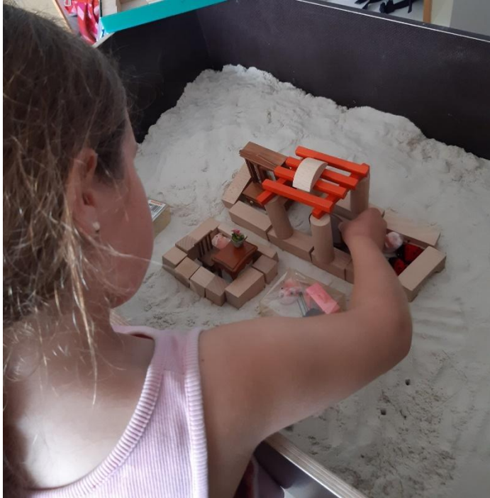
Abbildung 5: Sandspiel

Zudem ist der achtsame Umgang mit Übertragung wesentlich, wie das folgende Beispiel zeigt: Eine Therapeutin möchte einem Kind helfen, Lernblockaden zu überwinden. Es sagt: «Danke für Ihre tollen Ideen, Frau X.» Die Therapeutin kann antworten: «Nichts zu danken. Die kommen mir, wenn ich in deine Augen gucke.» Die Therapeutin kann dadurch einem Kind das zurückspiegeln, was es in ihr sieht. Das ist sehr wirksam und öffnet den Weg zur Selbstwirksamkeit und innerer Freiheit.