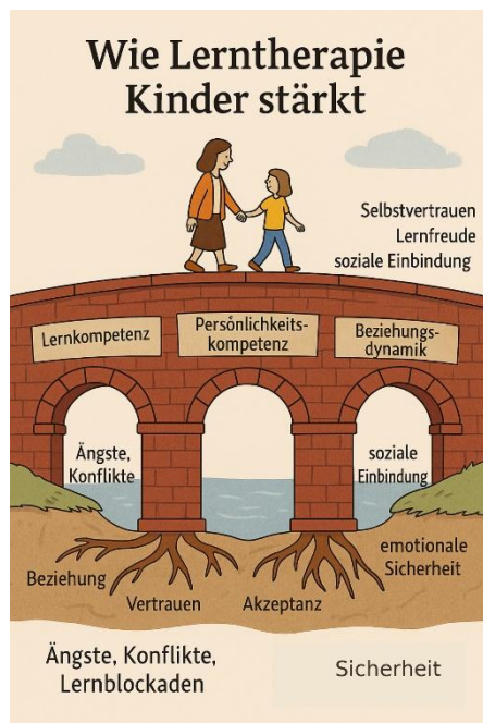
Abbildung 1: Lerntherapie: Gemeinsam über Brücken gehen (generiert mit KI, abgerufen am 25.07.2025)