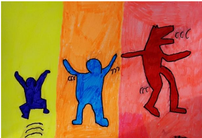
Abbildung 4: Entwicklung vom verzweifelten Schreienden ohne Impulskontrolle zum befreiten Ich, das in die Luft springt (© J. M. Ariana).

Ein zentrales Element der Lerntherapie ist die symbolische Darstellung innerer Konflikte. Das Sandspiel ermöglicht Kindern einen nonverbalen Ausdruck ihres seelischen Erlebens (vgl. Abb. 5). Beim Spielen mit Figuren, Gebäuden und Materialien stellen sie häufig unbewusst familiäre oder schulische Spannungen dar. Diese Szenen sprechen nicht über